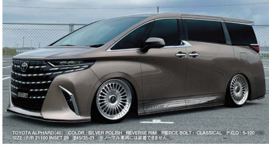
TOYOTA ALPHARD(40) COLOR: SILVER POLISH REVERSE RIM PIERCE BOLT: CLASSICAL P.C.D.: 5-120 SIZE: F/R 2100 INSET 29 245/35-21 ※ノーマル車両には装着できません。