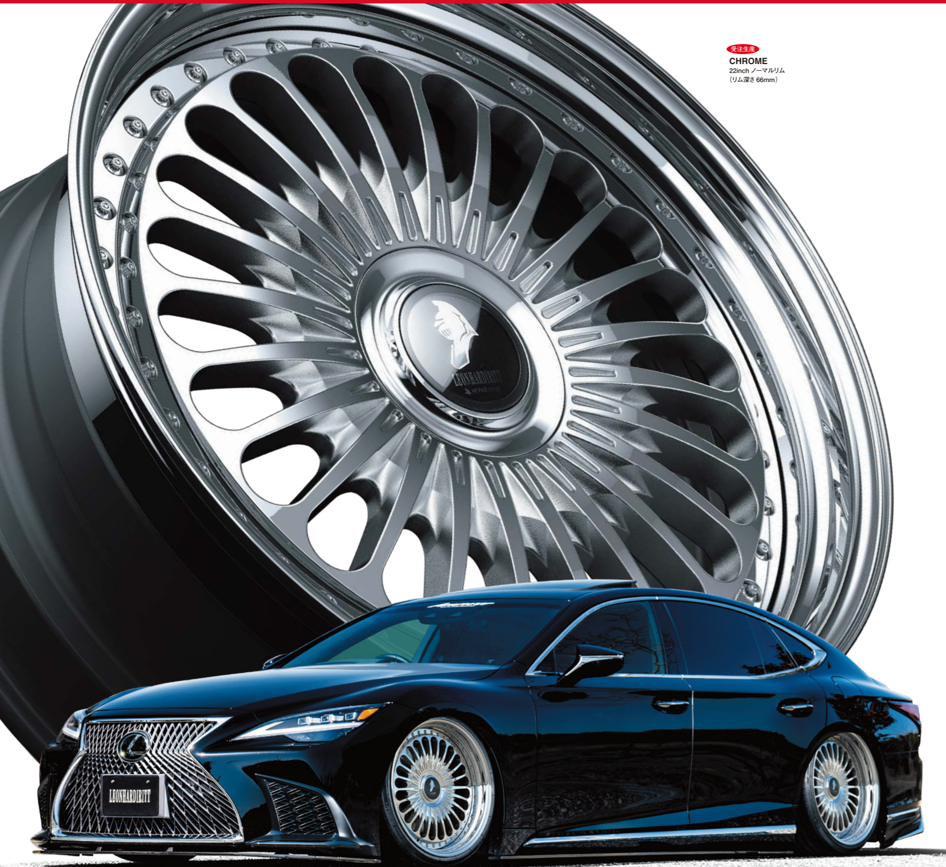
受注生産 CHROME 22inch ノーマルリム (リム深さ 66mm)