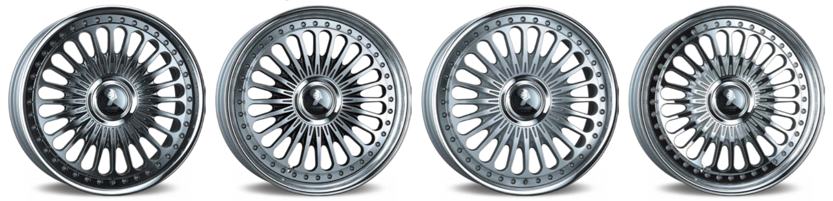
TITAN GRADATION 21inch リバースリム (リム深さ 66mm)

LEXUS LS(50) COLOR: CHROME NORMAL RIM P.C.D.: 5-120 5-120 SIZE: F 22105 INSET 24 255/30-22 R 22105 INSET 19 255/30-22 ※ノーマル車両には装着できません。