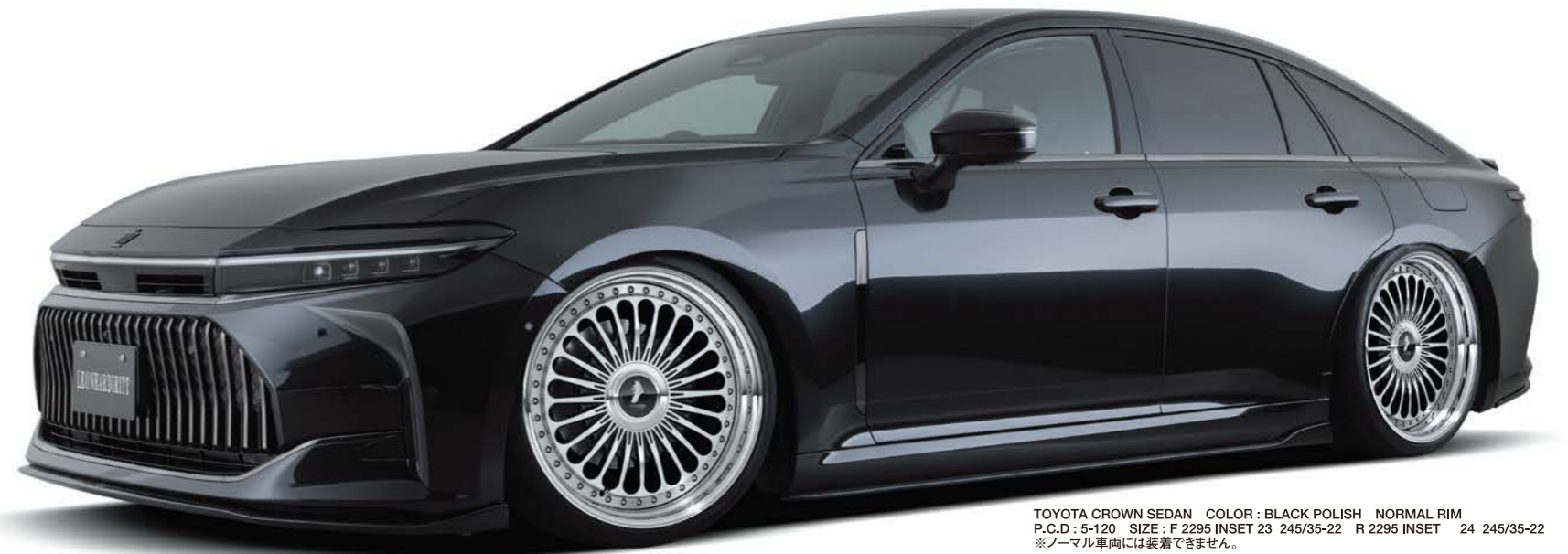
TOYOTA CROWN SEDAN COLOR: BLACK POLISH NORMAL RIM P.C.D.: 5-120 SIZE: F 2295 INSET 23 245/35-22 R 2295 INSET 24 245/35-22 ※ノーマル車両には装着できません。