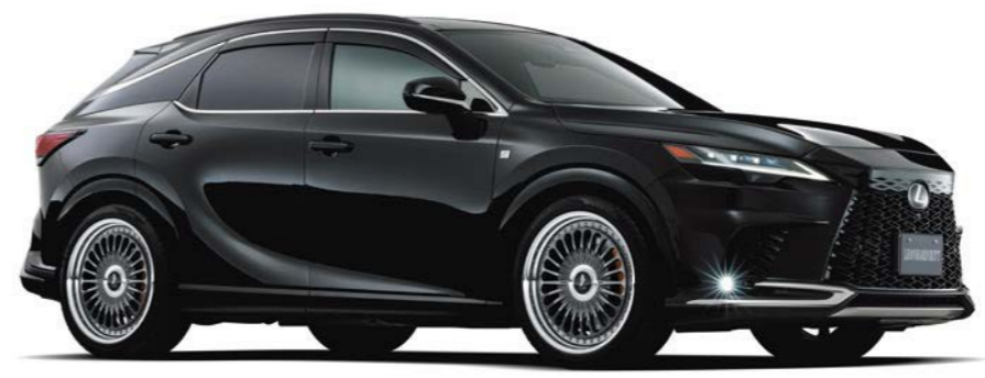
LEXUS RX COLOR: TITAN GRADATION NORMAL RIM P.C.D.: 5-114.3 SIZE: F/R 2290 INSET 43 265/40-22