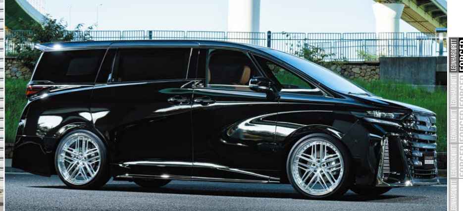
TOYOTA VELLFIRE (40) COLOR: MACHINING CLEAR REVERSE RIM PIERCE BOLT: TITAN HEAT P.C.D.: S-120 SIZE: F/R 2290 INSET 40 255/35-22 ※ローダウンが必要です