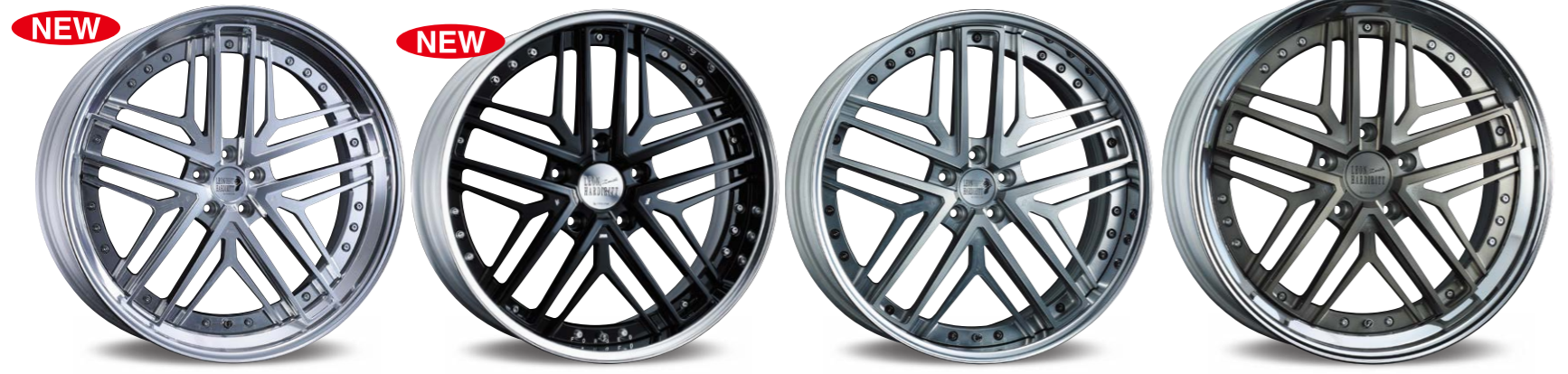
※注意 MACHINING CLEAR 24inch ノーマルリム (リムオーバーディスク) (リムの深さ 70mm) ※注意 PIANO BLACK 22inch リバースリム (リムの深さ 82mm) ※注意 MATTE SMOKE MACHINING 22inch リバースリム クラシカルピアスボルト (リムの深さ 70mm) ※注意 MATTE BRONZE MACHINING 24inch ノーマルリム (S-150 FACE) (リムの深さ 70mm)

※削り出しディスクのため多少の加工跡(カッターマーク)が発生しますが、削り出しディスクの特性とご理解ください。