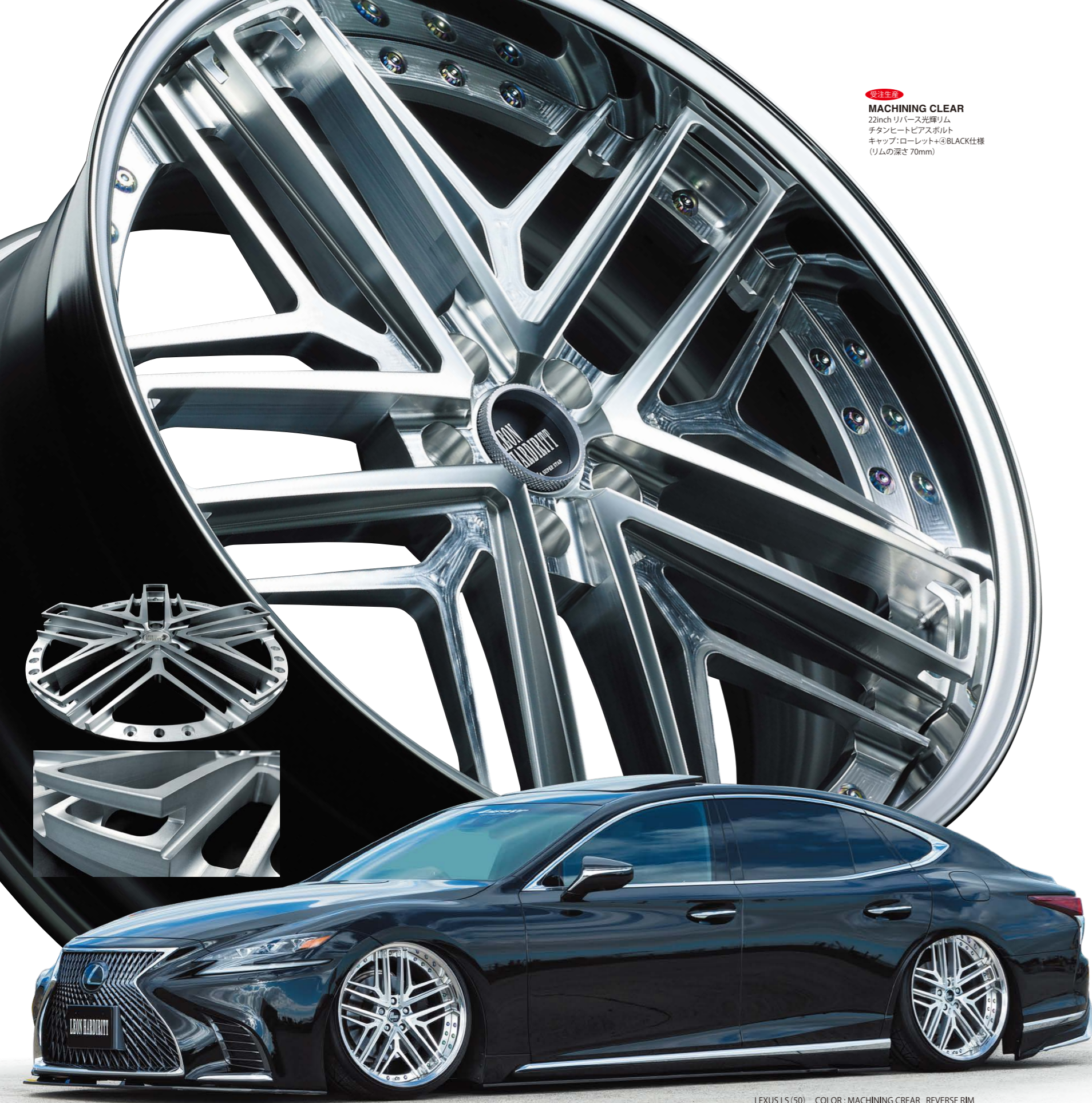
※注意 MACHINING CLEAR 22inch リバースリム チタンヒートピアスボルト キャップ:ローレット+③BLACK仕様 (リムの深さ 70mm)