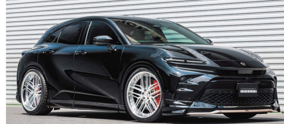
TOYOTA CROWN SPORT COLOR: MACHINING CLEAR REVERSE RIM P.C.D.: S-114.3 SIZE: F 2295 INSET 36 263/35-22 R 2295 INSET 33 265/35-22 ※ローダウンが必要です

※削り出しディスクのため多少の加工跡(カッターマーク)が発生しますが、削り出しディスクの特性とご理解ください。