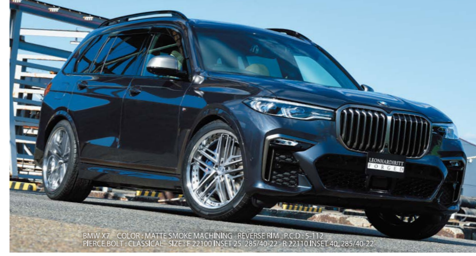
BMW X7 COLOR: MATTE SMOKE MACHINING REVERSE RIM P.C.D.: S-112 PIERCE BOLT: CLASSICAL SIZE: F 22110 INSET 25 285/40-22 R 22110 INSET 40 285/40-22